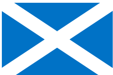
drapeau écossais croix de saint André

Une pièce en forme de croix de saint André porte le nom de sautoir (en anglais : saltire ).